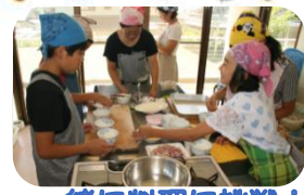
一緒に料理に挑戦!