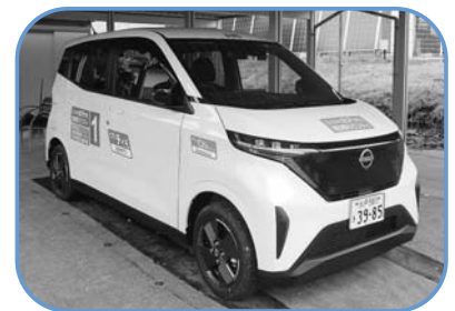
2年目を迎えた地域モビリティ事業