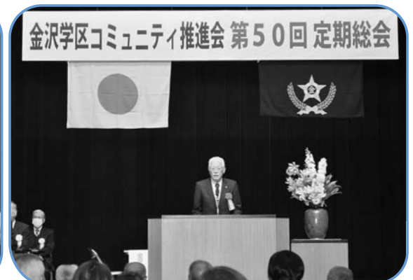
小川市長のご祝辞