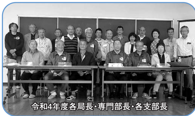
令和4年度各局長・専門部長・各支部長

今後も新型コロナウイルス感染症の終息への見通しが立たない中ではありますが、ウィズコロナ、アフターコロナを見据えて、新しい生活様式を踏まえながら、「自分の地域は自分の創意と努力でつくり上げる」というコミュニティ推進会の理念を各支部の皆さんと共有し、だれもが「この学区に住んでよかった」「住み続けたい」と実感できるまちづくりにするために事業に取り組んでまいります。