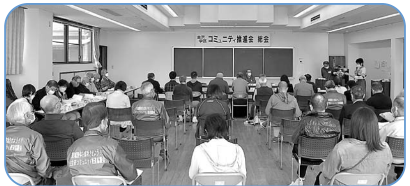
令和4年度第48回コミュニティ推進会定期総会

今年度から専門局を設けて、類似の専門部の活動が一体化できるように規則を改定しました。総務局、ふるさと・文化局、ふれあい局、地域福祉局にそれぞれ専門部が所属して、各支部と連携して事業の展開を図っていきます。各専門部の事業内容は、従来通りで進めていきます。