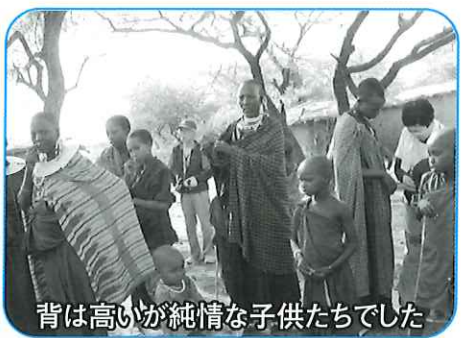
背は高いが純情な子供たちでした

我先に走っていた車が、しっかりと止まって横切るのを待っている。生活は貧しいが子供達の未来は明るい。「お医者さんになる」「学校の先生に」とそれぞれ夢をもっている。隣の国ケニアのマサイ族は一夫多妻制で、20人の子供がいれば国が学校を作ってくれるという。遠くの学校に通うためライオンの生息地を通らなければならない子供達もいる。