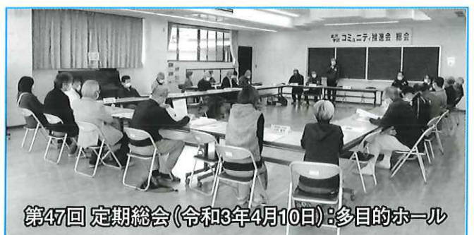
第47回 定期総会(令和3年4月10日) 多目的ホール

今年度は東京オリンピックが実施される予定です。新型コロナウイルス感染症のワクチン接種は始まったものの、変異型ウイルスの関係もあり収束の可能性は予断を許しません。金沢学区住民一体となってこの難局を乗り切っていきたいと考えます。