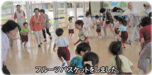
フルーツバスケットをしました