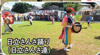
日立さんさ踊り(日立さんさ連)