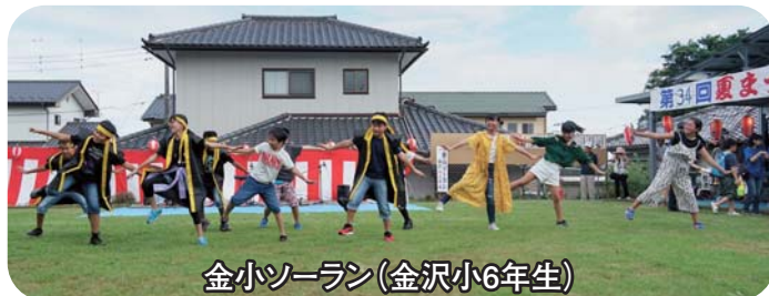
金小ソーラン(金沢小6年生)