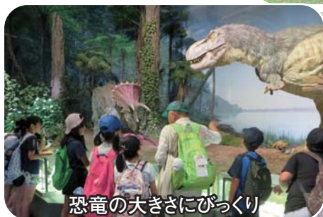
恐竜の大きさにびっくり