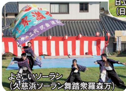
よざこいソーラン(久慈浜ソーラン舞踏衆羅森万)