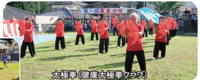
太極拳(健康太極拳クラブ)