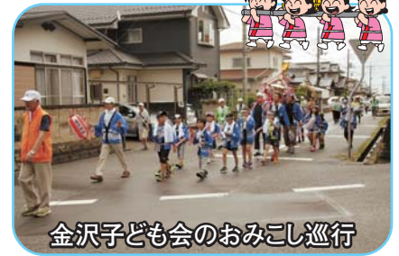
金沢子ども会のおみこし巡行

第34回夏まつりが、7月28日(日)に金沢交流センターで行われました。午前中に予定された「子どもみこし」の支部内巡行はあいにくの天候のため、金沢団地支部のみとなりましたが、午後になると梅雨明けを思わせる夏空になり、模擬店、各種発表会、ゲームコーナー、盆踊り、健康コーナー、そして抽選会の6つのプログラムのすべてを、楽しく大変にぎやかに終了できました。