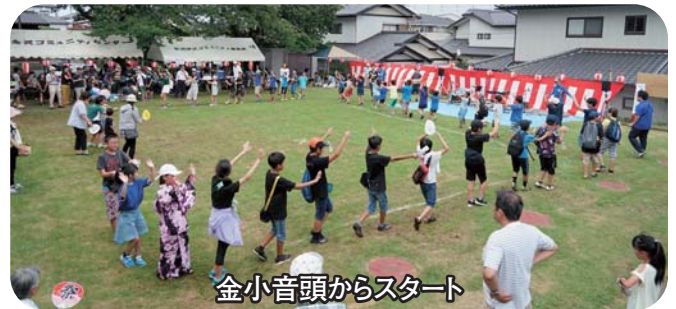
金小音頭からスタート

各種発表会は14時に「金小音頭(金沢小児童)」で始まり、初参加の「国体ダンス2019」、「ウクレレ演奏」、「踊り好きになった人」、「楽器演奏」が披露され、全部で9つのグループにより熱演が続きました。