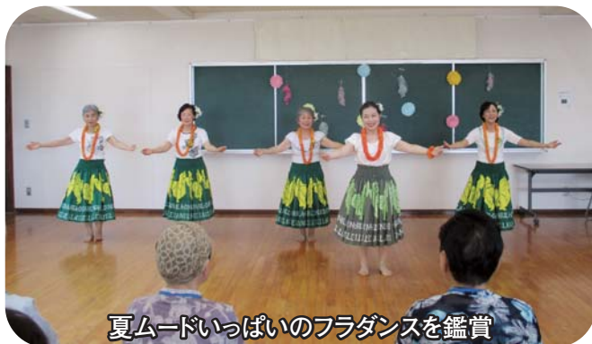
夏ムードいっぱいのフラダンスを鑑賞