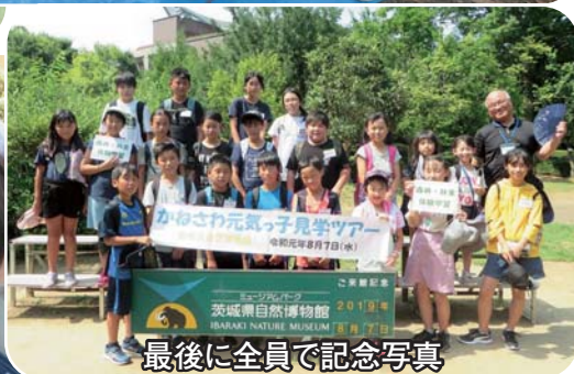
最後に全員で記念写真