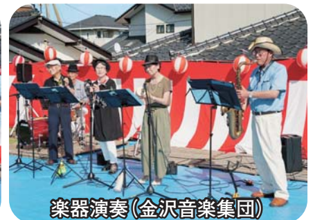
楽器演奏(金沢音楽集団)