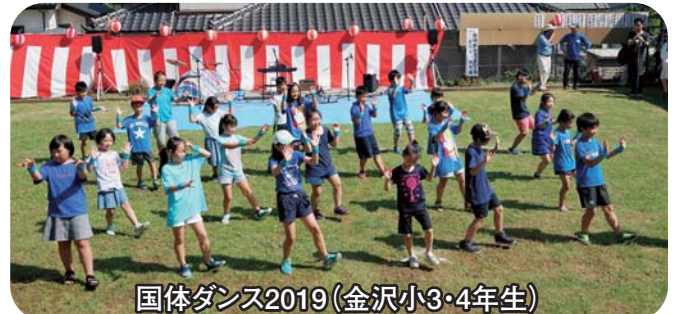
国体ダンス2019(金沢小3・4年生)