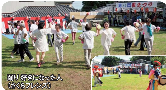
踊り好きになった人(さくらフレンズ)