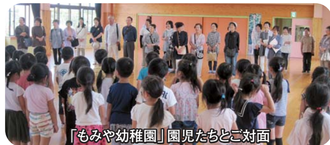
「もみや幼稚園」園児たちとご対面