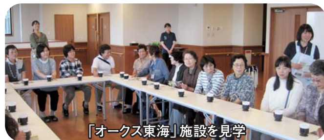
「オクス東海」施設を見学