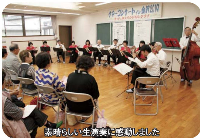
素晴らしい生演奏に感動しました

《合唱タイム》では、会場一体となり、かつての青春時代が蘇りました。《曲当てクイズ》コーナーでは、頭の体操宜しく楽しい音楽講座でした。心を癒す優しいマンドリン演奏は、普段得ることのない貴重な時間でした。(ふるさと創生塾)