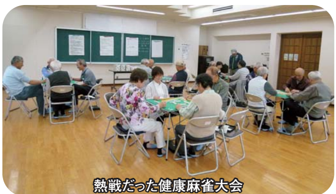
熱戦だった健康麻雀大会