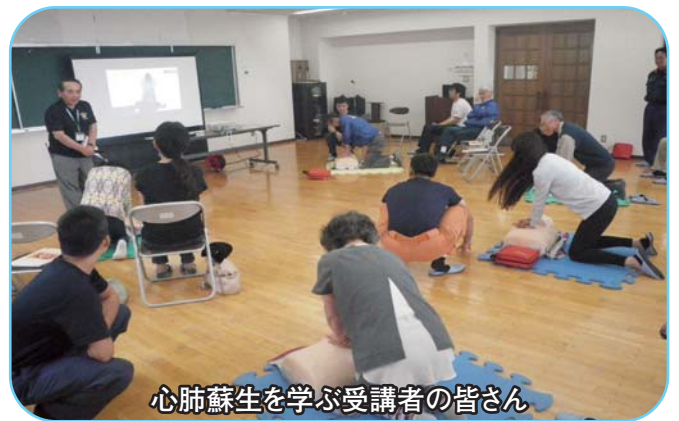
心肺蘇生を学ぶ受講者の皆さん