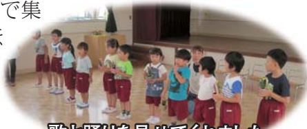
歌と踊りを見せてくれました

わずか3ヶ月で集団生活がこれほど出来る事に驚きました。元気に成長して欲しいと願います。