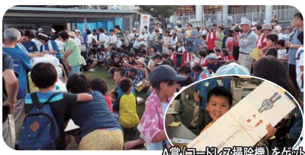
A賞(コードレス掃除機)をゲット

当選本数を特別賞とA賞からD賞までの合計65本と増やした抽選会は、当たった人の喜びと、当たらなかった人のざわめきで、大いに盛り上がりました。