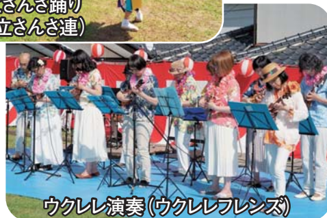
ウクレレ演奏(ウクレレフレンズ)