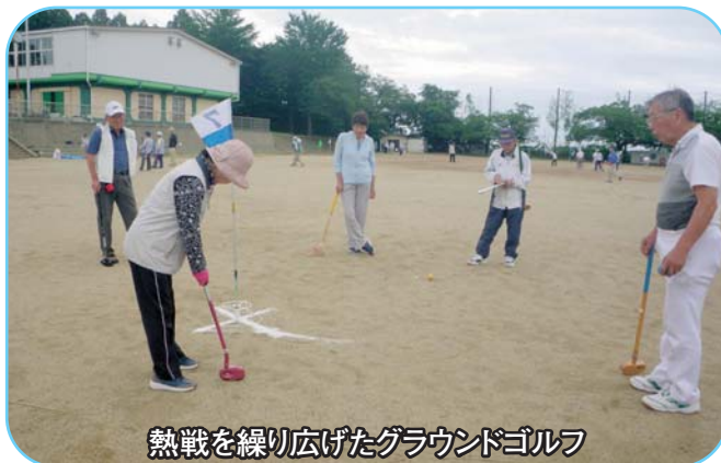
熱戦を繰り広げたグラウンドゴルフ

当日まで天候が心配されましたが、スタッフの熱意が通じたのか無事開催する事ができました。令和最初の大会とあって、参加者の意気込みも並々ならぬものがあったように感じられました。また技術も年々向上し好スコアが続出していました。表彰式が和やかに行われ次回への更なる技術の向上を確認していました。(レクリエーション部)