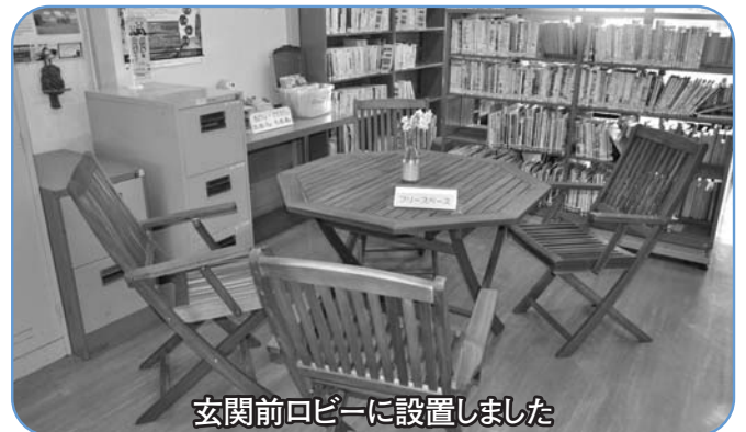
玄関前ロビーに設置しました