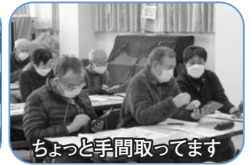
ちょっと手間取ってます