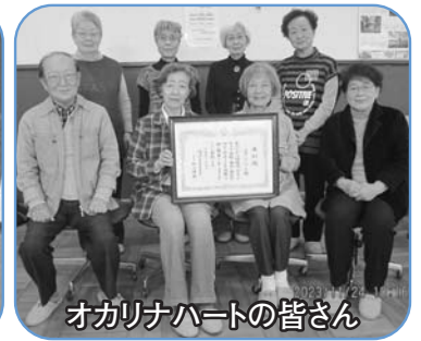
オカリナハートの皆さん