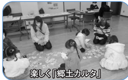
楽しく「郷土カルタ」