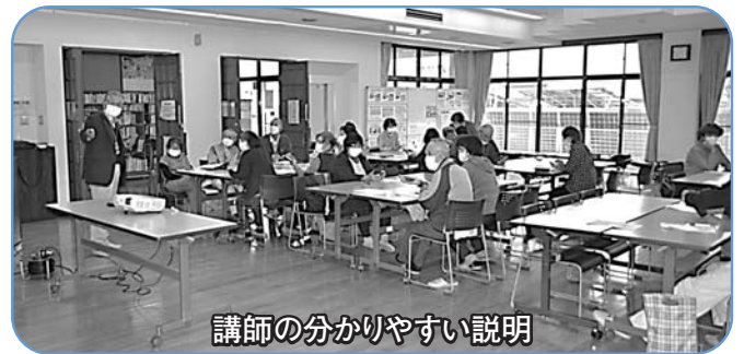
講師の分かりやすい説明