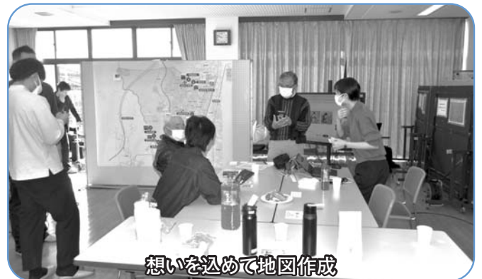
想いを込めて地図作成