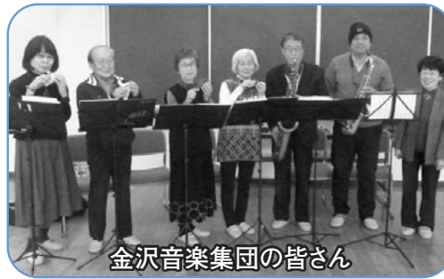
金沢音楽集団の皆さん

金沢交流センターの利用団体である「金沢音楽集団」と「オカリナハート」の2団体が、長年のボランティア活動により地域社会の福祉の増進に貢献した功績が認められ、県及び市の社会福祉協議会から表彰されました。おめでとうございます。今後の活動を期待するとともに、応援します。