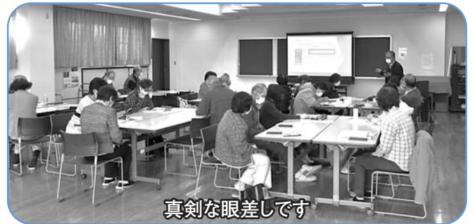
真剣な眼差しです

令和6年度も引き続き、デジタル勉強会を開催していきます。スマートフォン初心者の多数の参加をお待ちしています。 (地域モビリティ部)