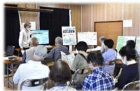
金沢団地支部の 住民説明会の様子